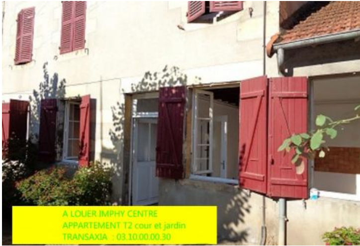
A LOUER IMPHY CENTRE APPARTEMENT T2 cour et jardin TRANSAXIA : 03.10.00.00.30