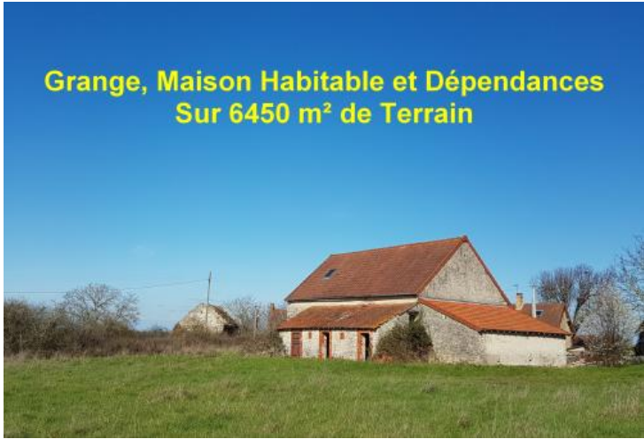
Grange, Maison Habitable et Dépendances Sur 6450 m 2 de Terrain