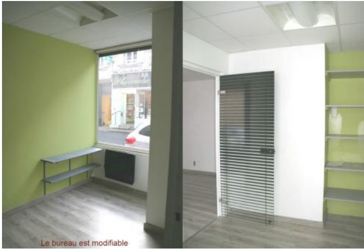
Le bureau est modifiable